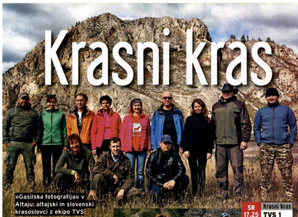
»Gasilska fotografija« v Altaju: altajski in slovenski krasoslovci z ekipo TVS