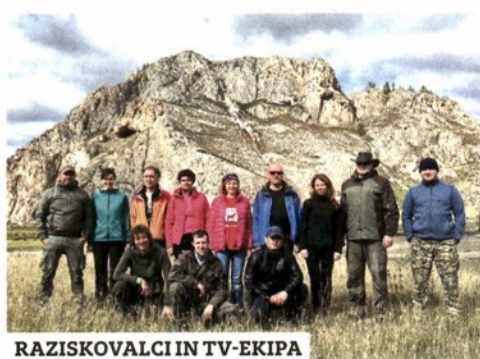
RAZISKOVALCI IN TV-EKIPA